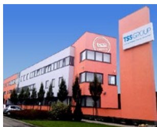
Dubnica nad Váhom