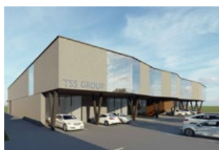
Dubnica nad Váhom